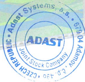
Razítko Adast Systems, a.s.