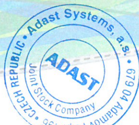
Razítko Adast Systems, a.s.